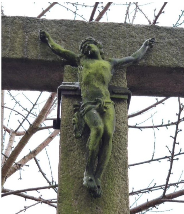
Kříž u posedu nad nádražím | 6. únor 2021